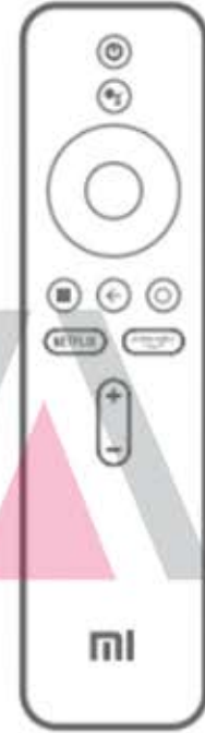
Sesli Uzaktan Kumanda

* 2×AAA pil gereklidir. Kutuya dahil değildir.