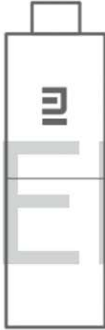
Mi TV Stick